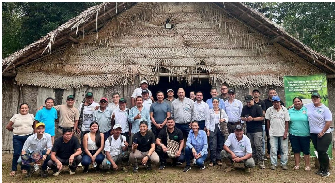
Asistentes a la reunión en Mitú entre comunidades, MME y Gensa.

Una jornada de trabajo de llevó acabo con la participaron representantes de las comunidades indígenas del Área de Influencia Directa (AID) de la PCH de Mitú, a través de AATICAM, representantes del Ministerio de Minas y Energía (MME), de Ceelva, como operador de la red, y de Gensa, como generador de energía.