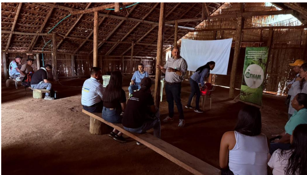
Presidente de GenSA socializando la gestión de la PCH en la jornada de trabajo

Entre los temas principales del encuentro, que se desarrolló el pasado 11 de diciembre, estuvieron la Transición Energética Justa y el funcionamiento de la PCH, dado que algunas comunidades expresan que no cumple el objetivo para el cual fue construida y se debería pensar en otro tipo de generación de energía.