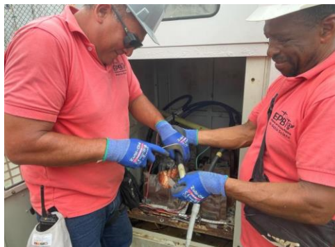
Durante el proceso de reparación de los equipos

Con el fin de restablecer el servicio en el menor tiempo posible, el personal de GENSA y EPB iniciaron labores de reparación inmediatamente y se notificó esta situación operacional al Centro Nacional de Monitoreo del IPSE, propietario de estos equipos y que se encargará de la reposición de los mismos.