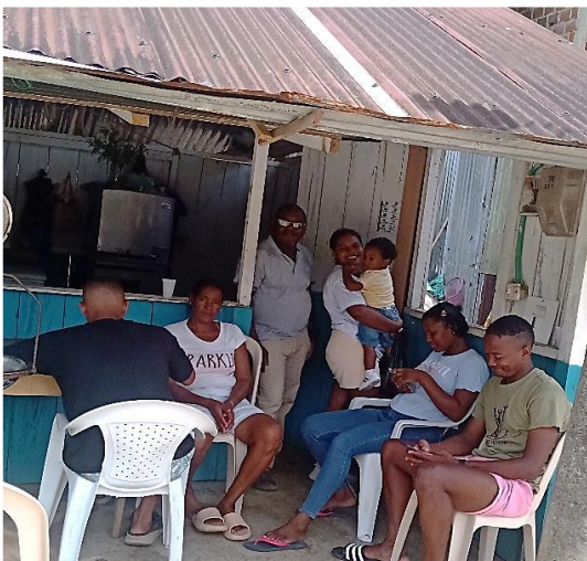
Proceso de selección Abriendo Fronteras 2023, en Bahía Solano.

Gensa, con gran satisfacción, logró dar inicio a la segunda cohorte del proyecto para lo cual adelanta el proceso de selección de estudiantes, que se hayan destacado académicamente, quienes serán beneficiados con becas completas para realizar su formación universitaria.