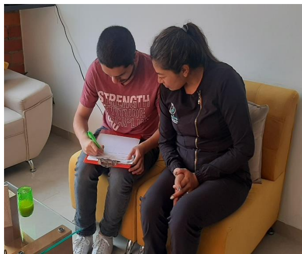
Proceso de selección Abriendo Fronteras 2023, en Paipa.