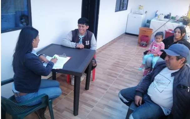
Proceso de selección Abriendo Fronteras 2023, en Paipa.

Este grupo estará integrado por cinco (5) estudiantes quienes serán seleccionados de las comunidades que hacen parte de las áreas de influencia donde Gensa hace presencia como: Paipa (Boyacá), Mitú (Vaupés), Bahía Solano (Chocó), Inírida (Guainía) y de Samaná (Caldas).