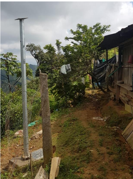
Instalación de estructura de soporte para los paneles.