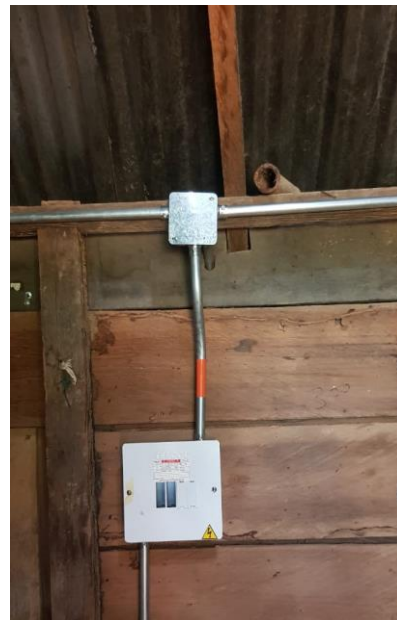
Construcción de instalaciones internas Usuario ID 166 vereda El Edén Bloque 1.