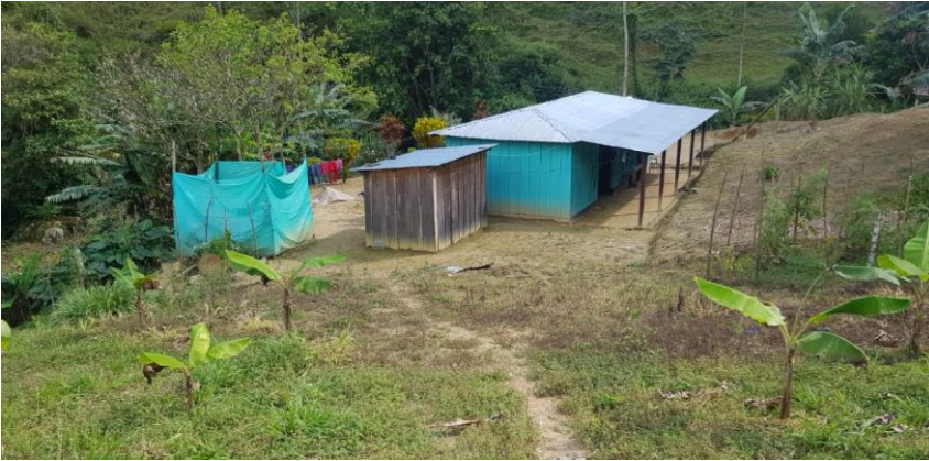
Usuario ID 108, vereda Nueva Granada bloque 1, tipo de vivienda característico de la región.