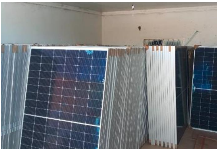
Paneles fotovoltaicos en la Bodega de almacenamiento en Curumaní, Cesar.